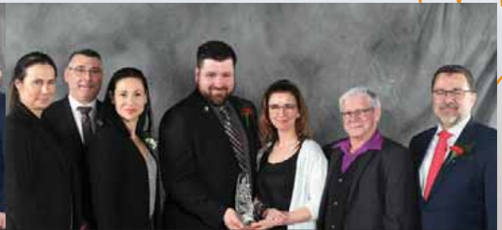
Syndicat de l'UPA de Beauharnois-Salaberry et la MRC de Beauharnois-Salaberry

Bulletin L'agriculture d'ici, une fertilité à cultiver!