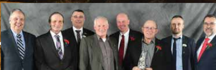
Les syndicats des producteurs de bovins de la Montérégie Ouest et Est

OPÉRATION MÉDIATIQUE RÉGIONALE DE LA PRODUCTION BOVINE