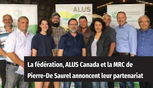
La fédération, ALUS Canada et la MRC de Pierre-De Saurel annoncent leur partenariat

Le 21 mai 2019, la MRC de Pierre-De Saurel a appuyé concrètement les agricultrices et les agriculteurs dans la mise en place de pratiques novatrices et respectueuses de l'environnement en milieu agricole en contribuant au programme ALUS Montérégie, pour un montant de 2 000 $ / année, et ce, pour une période de cinq ans. À ce jour, huit entreprises de la MRC de Pierre-De Saurel ont bénéficié du programme ALUS, ce qui représente une contribution totale de 15 000 $ pour la revalorisation de 4,1 hectares.