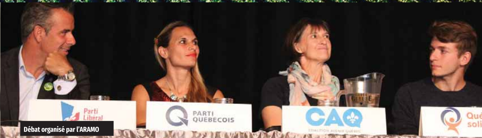
Débat organisé par l'ARAMO