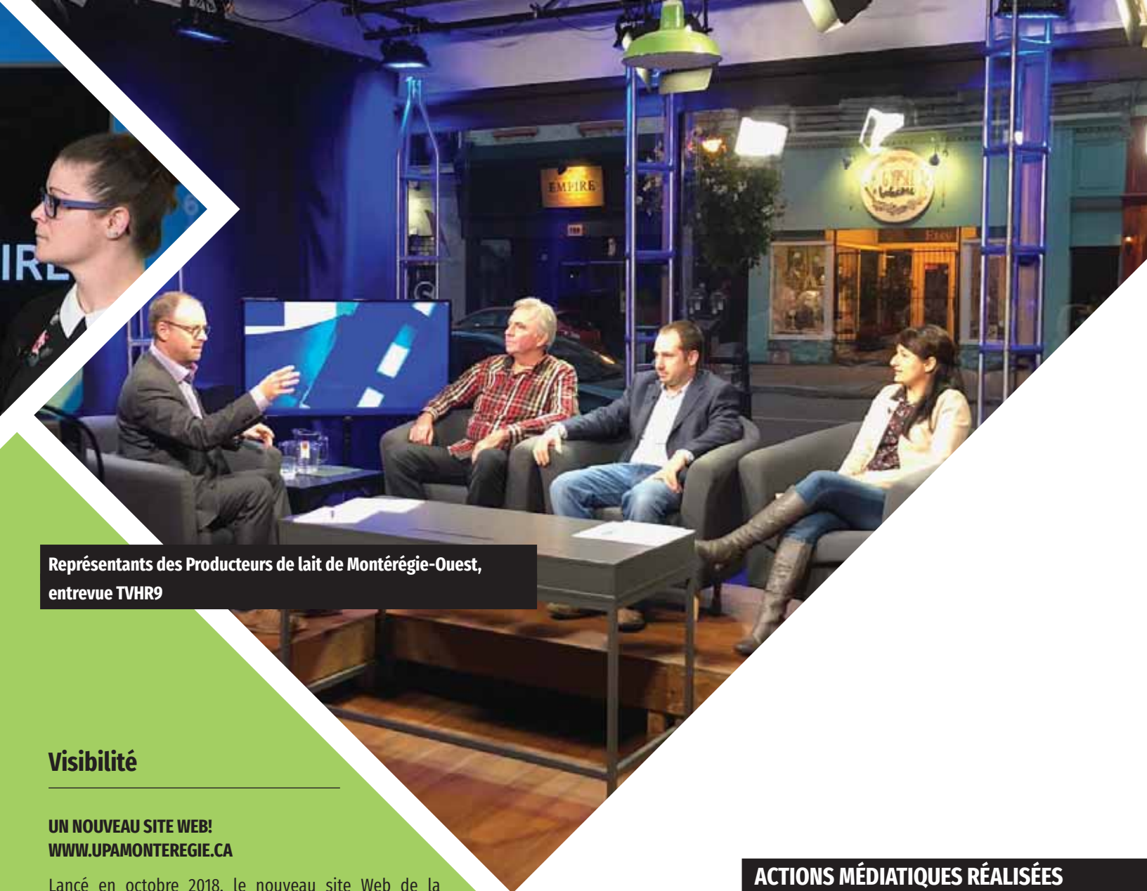
Représentants des Producteurs de lait de Montérégie-Ouest, entrevue TVHR9