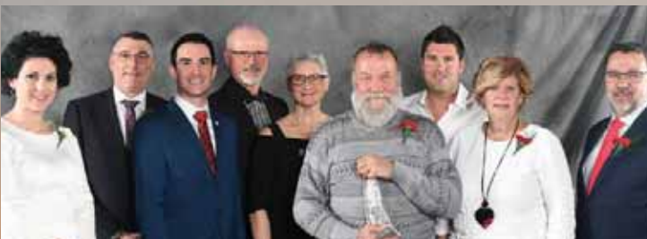
Les syndicats de l'UPA de la Vallée maskoutaine et des Maskoutains Nord-Est

CAMPAGNE DE SENSIBILISATION : CULTIVONS LA PATIENCE, C'EST LA BONNE VOIE!