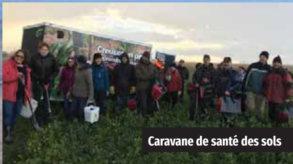
Caravane de santé des sols

Contribuer à l'amélioration de la qualité de l'eau et lutter activement contre les changements climatiques! La fédération a soutenu localement la mobilisation active des producteurs, en plus d'offrir de l'aide financière et des services techniques personnalisés aux entreprises agricoles désireuses de procéder à des aménagements agroenvironnementaux sur leur terre. Plusieurs événements didactiques, rencontres d'information et outils de sensibilisation ont été diffusés auprès des producteurs.