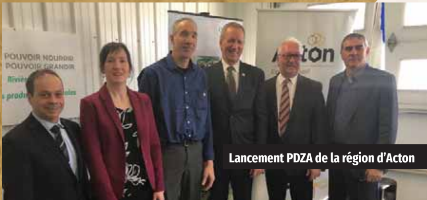
Lancement PDZA de la région d'Acton