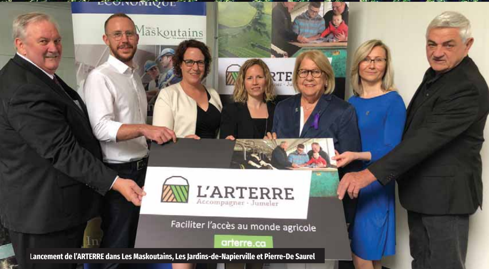
Lancement de l'ARTERRE dans Les Maskoutains, Les Jardins-de-Napierville et Pierre-De Saurel