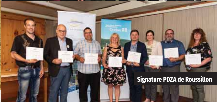
Signature PDZA de Roussillon