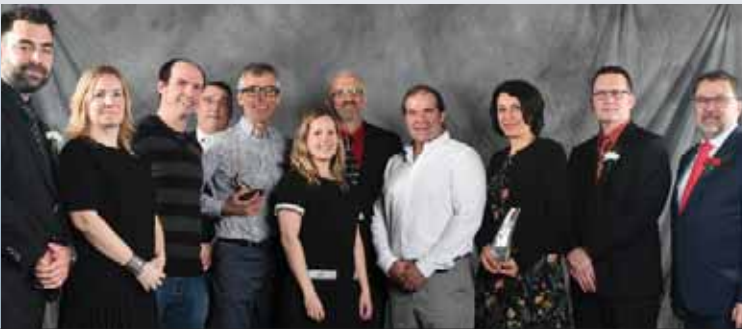
Syndicat de l'UPA de Richelieu-Yamaska et le Comité du bassin versant de la Rivière Pot au Beurre

Le Projet collectif agricole de la Rivière Pot au Beurre