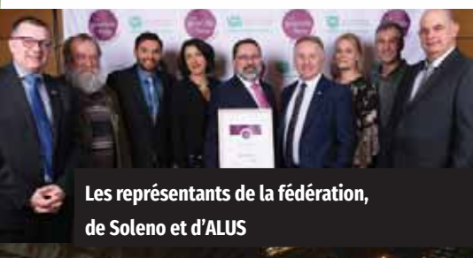
Les représentants de la fédération, de Soleno et d'ALUS

Le 5 décembre 2018 avait lieu le premier gala annuel agricole et forestier de l'Union des producteurs agricoles. Ce gala, nommé « La grande fête agricole et forestière », soulignait l'action collective en remettant quatre grands prix d'excellence. Le programme ALUS Montérégie faisait partie des finalistes pour remporter le prix Environnement - Hélène-Alarie.