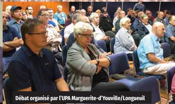
Débat organisé par l'UPA Marguerite-d'Youville/Longueuil