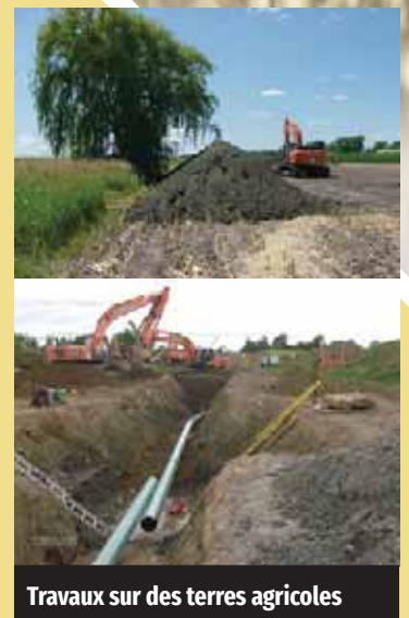
Travaux sur des terres agricoles

La Ville de Contrecoeur a finalement retiré son avis d'expropriation visant une famille agricole dans le but d'y implanter un pôle logistique. Supporté par la fédération, le Syndicat Marguerite-D'Youville/Longueuil continue ses démarches afin de s'assurer qu'aucun développement industriel ne se fasse sur les terres agricoles. La Communauté métropolitaine de Montréal ainsi que le Port de Montréal ont notamment été rencontrés cette année pour aborder cet enjeu majeur.