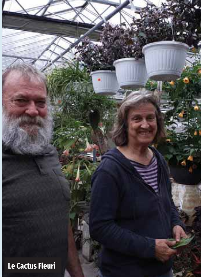
Le Cactus Fleuri

Chez Production Barry, le respect et la bonne communication sont la base des relations de travail harmonieuses. En collaboration avec le Centre d'Emploi agricole, ils ont également élaboré un manuel de l'employé afin de favoriser une meilleure intégration mais aussi que tous connaissent les règles de base de l'entreprise.