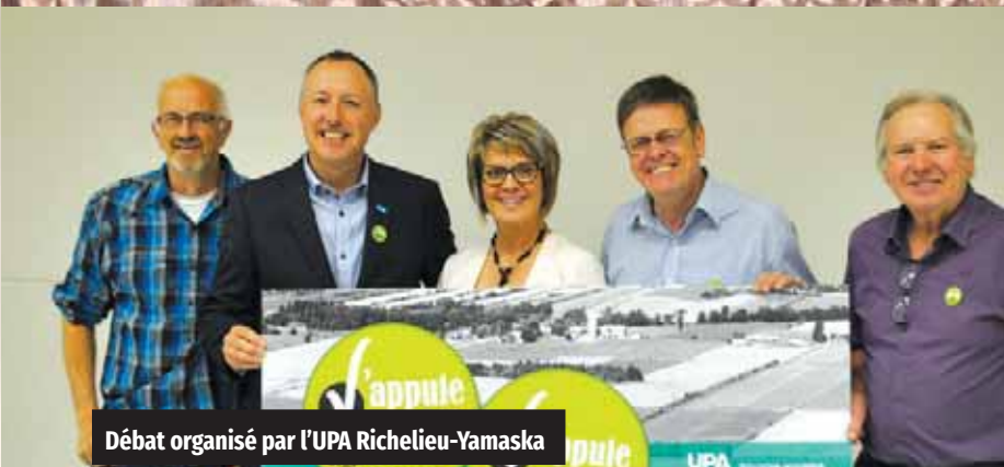
Débat organisé par l'UPA Richelieu-Yamaska