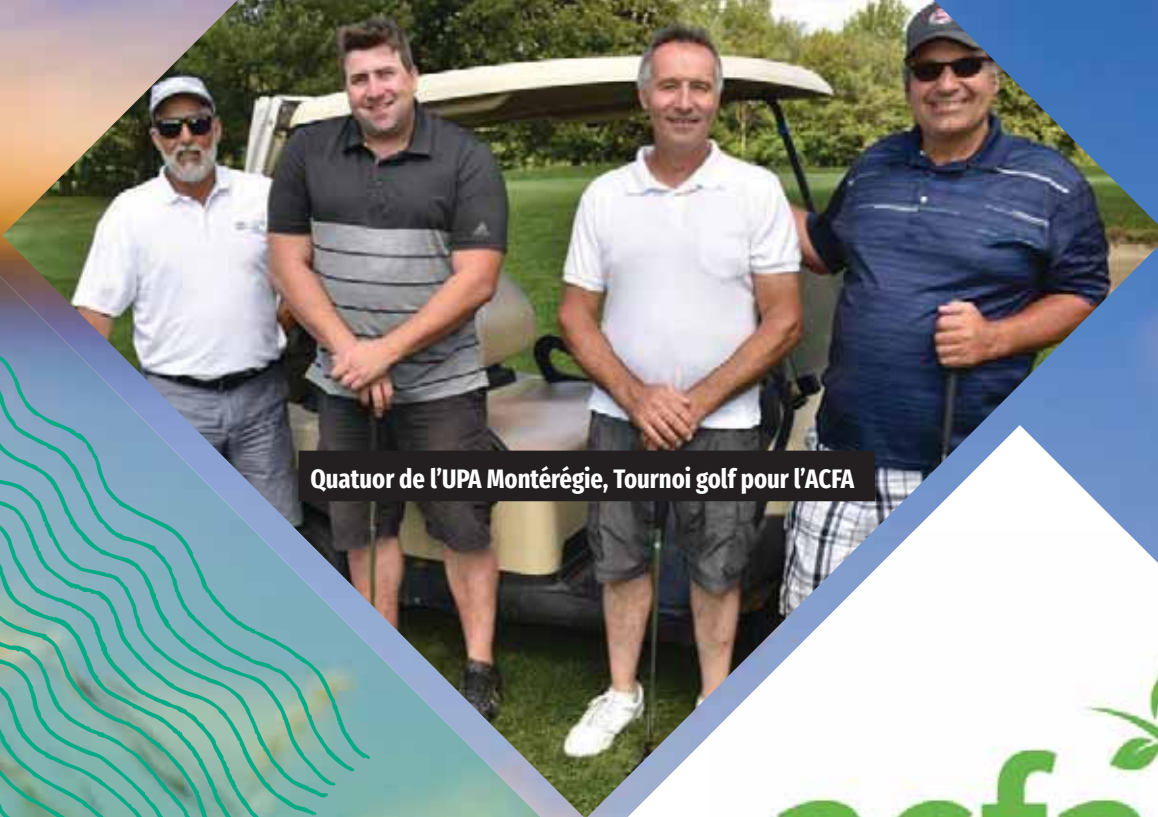
Quatuor de l'UPA Montérégie, Tournoi golf pour l'ACFA