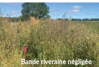
Bande riveraine négligée