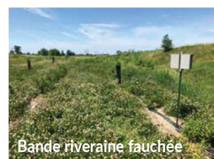
Bande riveraine fauchée