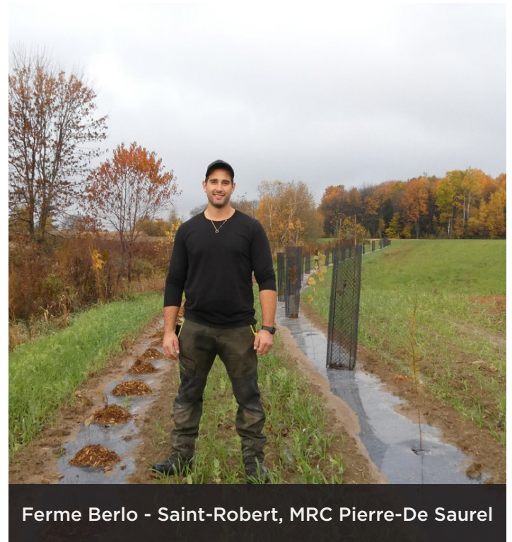
Ferme Berlo - Saint-Robert, MRC Pierre-De Saurel