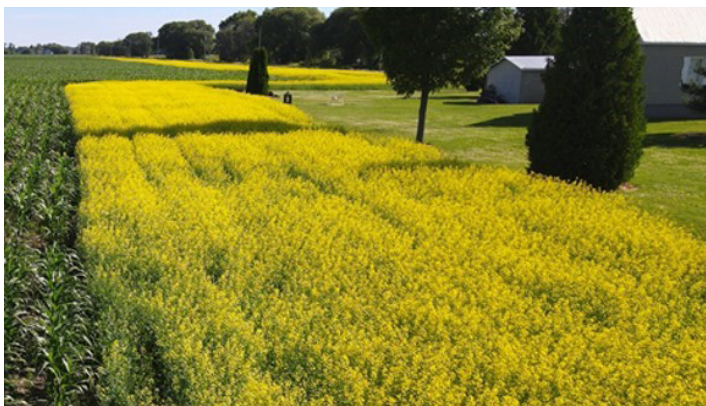
Bande fleurie (canola) pour les pollinisateurs - Saint-Robert, MRC Pierre-De Saurel