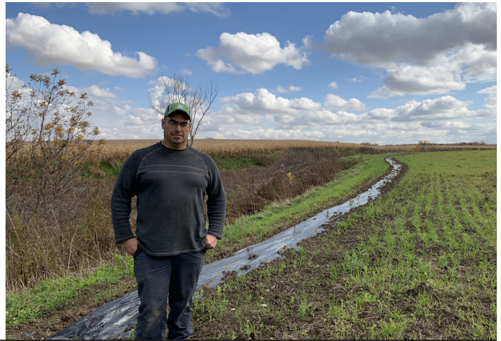
Bande riveraine élargie arbustive avec bande pour les pollinisateurs chez GEP Sorel - Saint-Mathias-sur-Richelieu, MRC de Rouville