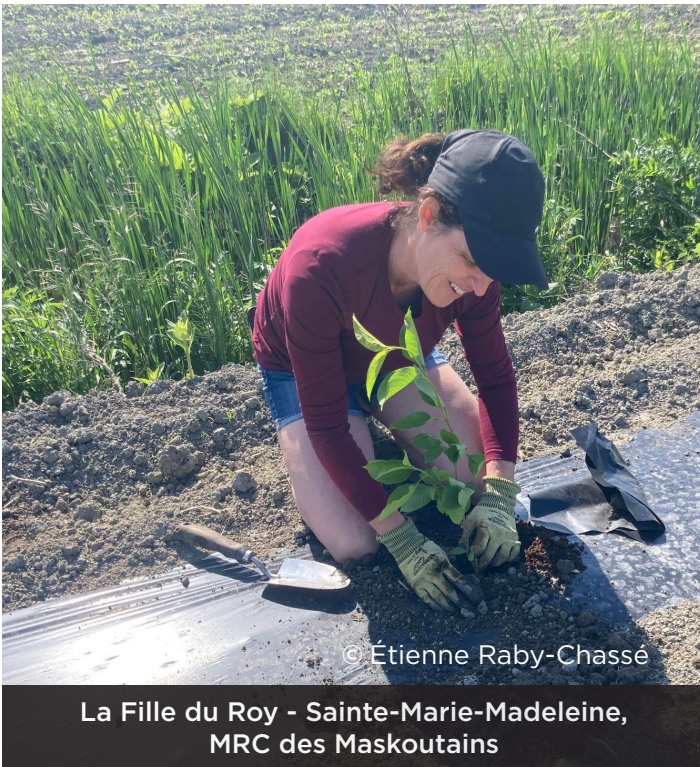
La Fille du Roy - Sainte-Marie-Madeleine, MRC des Maskoutains