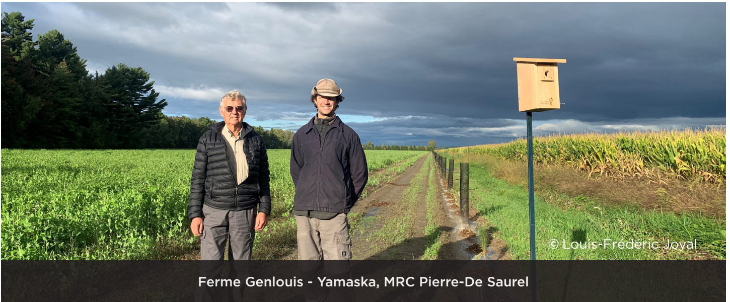
Ferme Genlouis - Yamaska, MRC Pierre-De Saurel