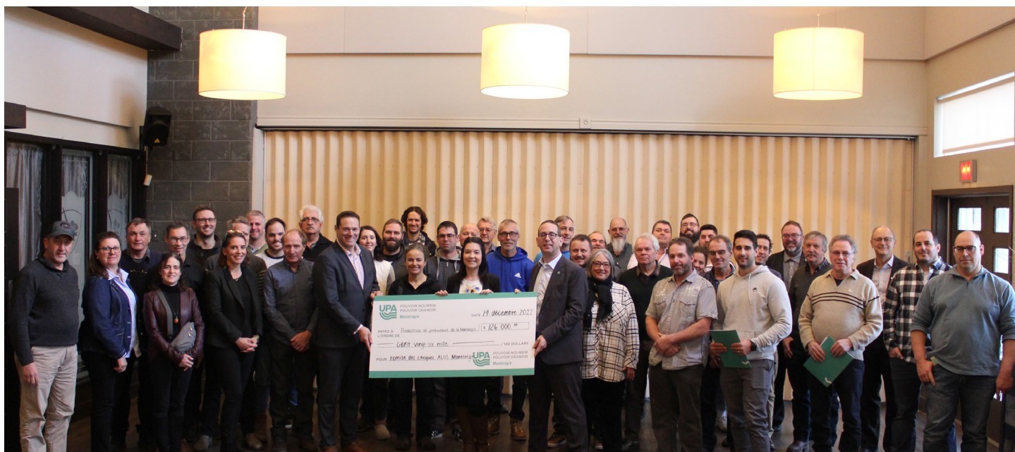
Cérémonie de remise des rétributions du programme ALUS Montérégie 2022