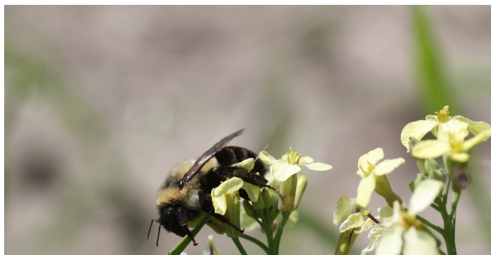
Bourdon trouvé dans une bande fleurie - Sainte-Martine, MRC Beauharnois-Salaberry

Pour en savoir plus sur les espèces en péril du territoire