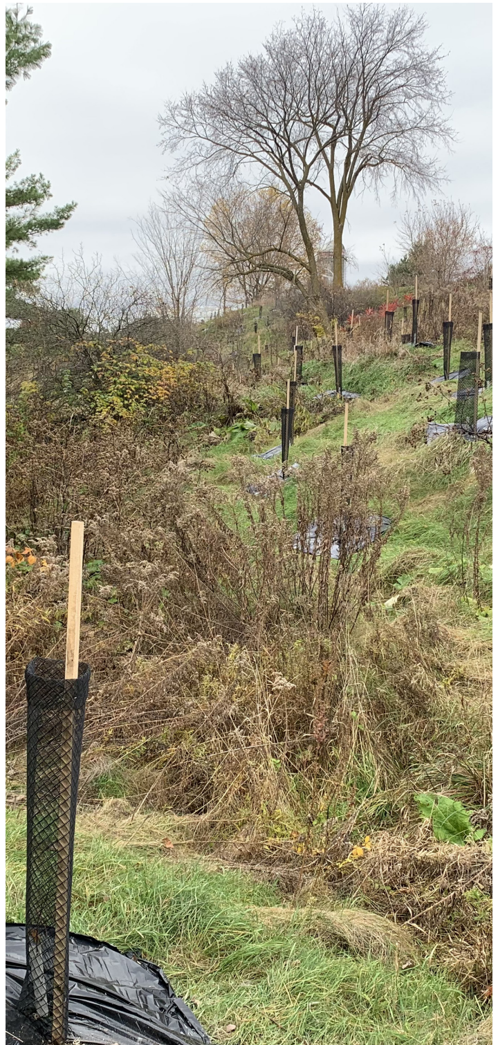
Reboisement de coulées agricoles à la Ferme G. Brouillard – Saint-Aimé, MRC Pierre-De Saurel

Pour cette septième année d'activités, les aménagements ont été réalisés dans plus de 21 municipalités situées dans 8 MRC de la Montérégie. De plus, il y a eu le renouvellement des projets dont l'entente de conservation est arrivé à terme : 11 producteurs ont vu leur entente renouvelée pour cinq années supplémentaires. C'est donc plus de 126 000$ remis aux producteurs pour des aménagements réalisés en 2022 et en 2017!