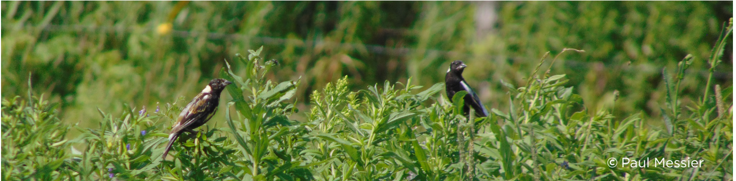
Goglus des prés dans un site de fauche retardée - Sainte-Victoire-de-Sorel, MRC Pierre-De Saurel

Les parcelles de foin qui ont été fauchées uniquement après le 15 juillet ont permis aux goglus des prés et aux sturnelles des prés de s'installer dans le champ de foin et de procéder à la nidification. Ce sont plus de 115 goglus des prés (mâles, femelles et juvéniles) qui ont été observés chez les trois entreprises agricoles lors de la saison 2022.