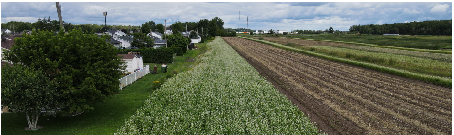
Bande fleurie (sarrasin et trèfles) - Sainte-Madeleine, MRC des Maskoutains