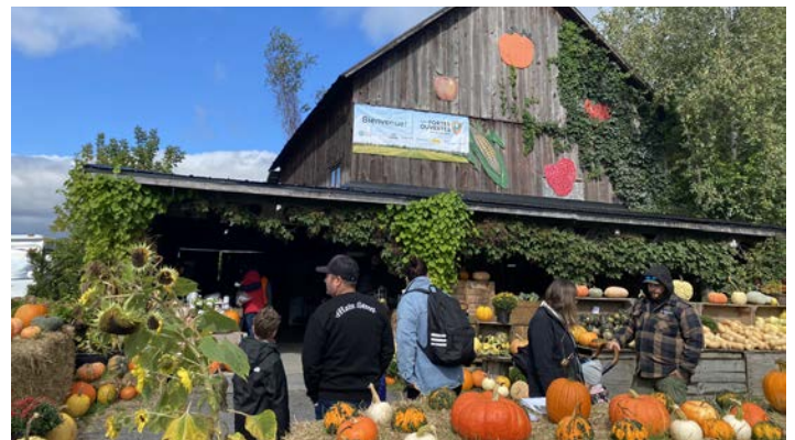
Le Roi de la Fraise Saint-Paul-d'Abbotsford