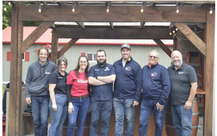
Domaine Labranche Saint-Isidore-de-Laprairie