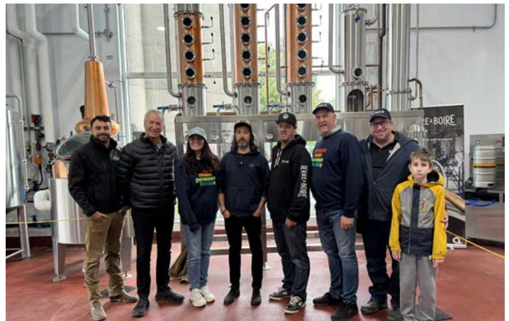
Terre à Boire Saint-Blaise-sur-Richelieu