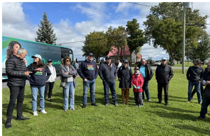
Ferme RETOMA inc. Saint-Blaise-sur-Richelieu