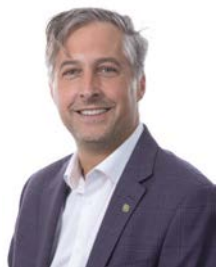
Charles Boulerice Saint-Jean-Baptiste