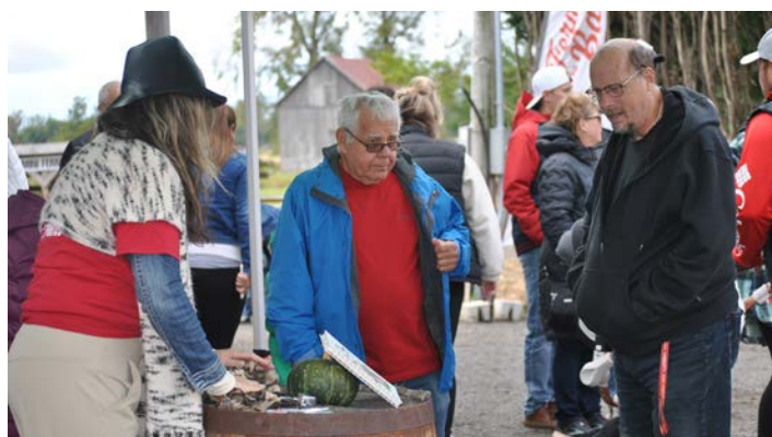
La Ferme du Barbu Sainte-Anne-de-Sorel