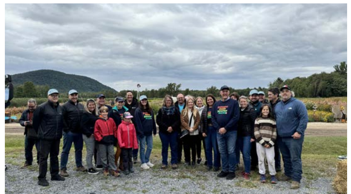
Les Jardins d'Abbotsford Saint-Paul-d'Abbotsford