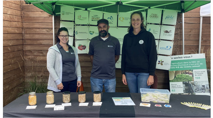
Ferme Cidricole Équinoxe Farnham