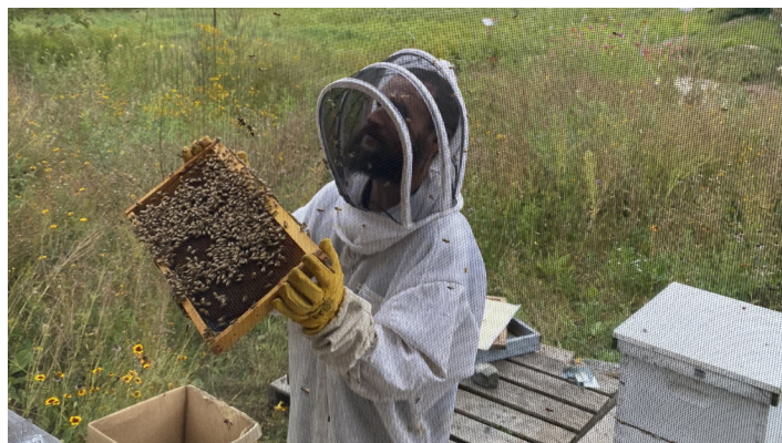
Miel Fontaine Sainte-Cécile-de-Milton