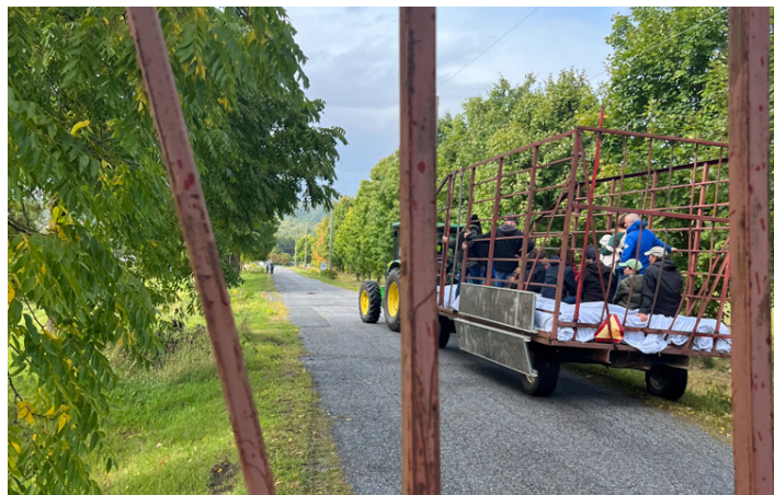
Ferme expérimentale de Frelighsburg Frelighsburg